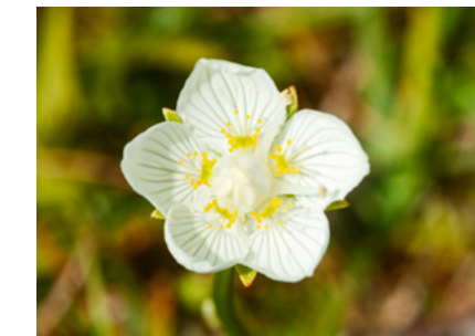
Parnassia komt veelvuldig voor in de Grevelingen

De Grevelingen is een voormalige zeearm tussen Goeree-Overflakkee en Schouwen-Duiveland. Het is het grootste zoutwatermeer van West-Europa. De slikken en visrijke wateren maken het een belangrijk gebied voor kustbroedvogels. De drooggevallen platen herbergen de grootste populatie groenknolorchis van Nederland en de grasachtige gebieden zijn het leefgebied voor de bijzondere noordse woelmuis. Fjordenpaarden, shetlanders en koeien grazen op de eilanden en de Slikken van Flakkee en de Slikken van Bommende. Ze helpen de vlaktes open te houden. De Grevelingen is