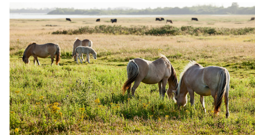
Fjordenpaarden grazen op de Slikken van Flakkee en op de eilanden in de Grevelingen

ideaal voor een dagje uit. Je kunt er surfen, zeilen, aanmeren op één van de bijzondere eilanden of heerlijk fietsen en wandelen. Het is ook een Natura 2000 gebied. Geniet van de natuur zonder deze te verstoren.